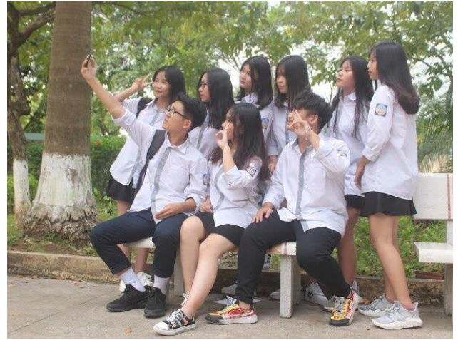
Nơi thư giãn sau mỗi giờ học.

Bảo dưỡng, sửa chữa đường nước phục vụ khu nhà vệ sinh, khu vực rửa tay của HS trước khi vào lớp học.