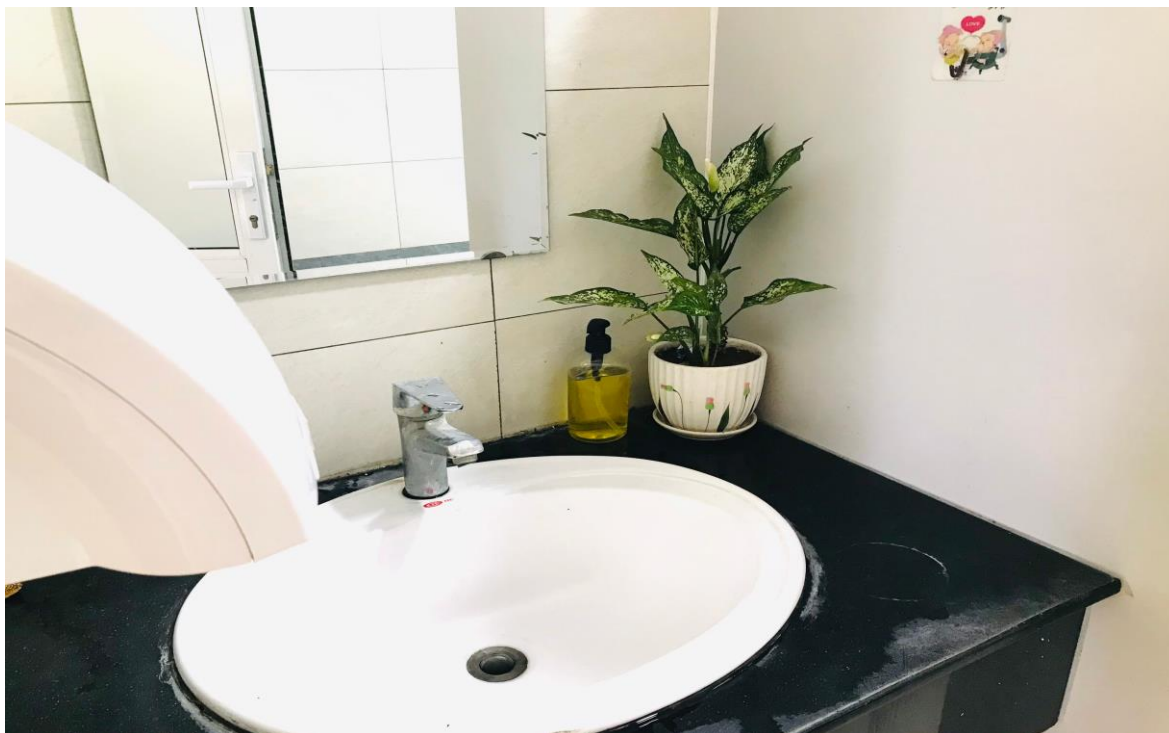
Nhà vệ sinh luôn sạch sẽ

Cảnh quan sân trường sạch đẹp, công trường được xây mới, tổng thể nhà trường trang hoàng, hài hòa, thẩm mỹ, phù hợp môi trường sư phạm, tường quét vôi mới, thay thế một số cửa sổ hỏng