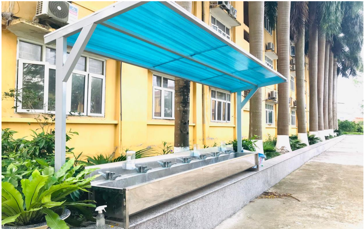
Khu vực rửa tay của HS trước khi vào lớp học.

Bảo dưỡng, sửa chữa đường nước phục vụ khu nhà vệ sinh, khu vực rửa tay của HS trước khi vào lớp học.